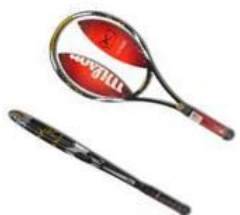
rakieta tenisowa kblade team Wilson