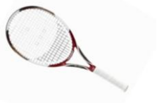
rakieta artengo plus torba artengo