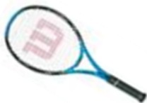
rakieta tenisowa ncode Wilson