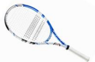
rakieta tenisowa Babolat